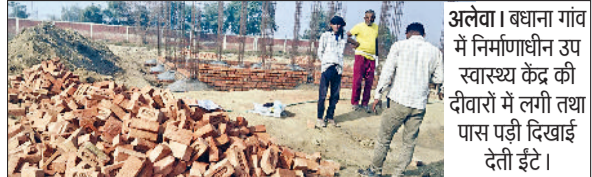
अलेवा। बधाना गांव में निर्माणाधीन उप स्वास्थ्य केंद्र की दीवारों में लगी तथा पास पड़ी दिखाई देती ईंटें।