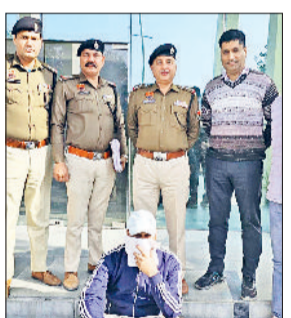
ऑस्ट्रेलिया भेजने के नाम पर लाखों की टगी मामले का आरोपी पुलिस गिरफ्त में।