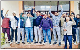
जुलाना। बिजली निगम कार्यालय में सरकार के खिलाफ नारेबाजी करते हुए बिजलीकर्मी।