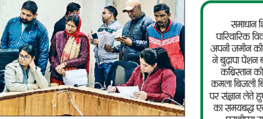
जौद। समस्याएं सुनते अतिरिक्त उपायुक्त।