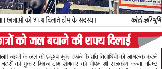
जुलाना। छात्राओं को शायप दिलाते टीम के सदस्य।