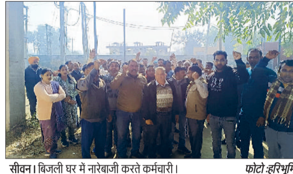
सौजन। बिजली घर में नारेबाजी करते कर्मचारी।