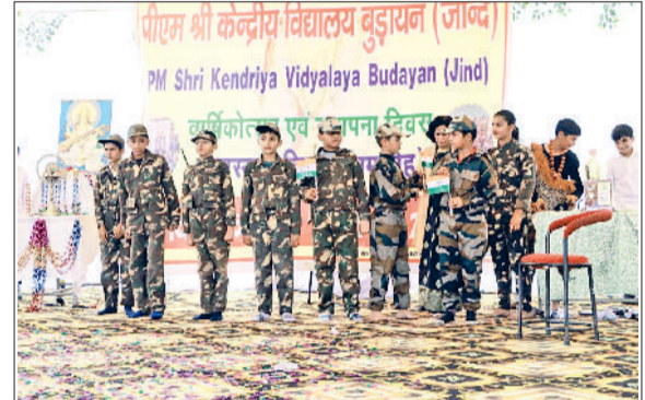
उचाना। कार्यक्रम में प्रस्तुति देते विद्यार्थी।

आधारित प्रेरक स्किट, त्योहारों पर आधारित सांस्कृतिक कार्यक्रम, सावन गीत, राजस्थानी नृत्य, पंजाबी नृत्य, स्किट, एक्ट एवं ऑपरेशन सिंदूर जैसी विविध एवं रंगारंग प्रस्तुतियों ने उपस्थित दर्शकों का मन