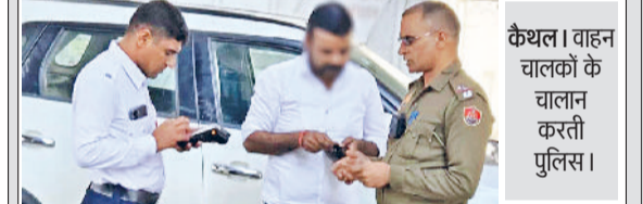
कैथल। वाहन चालकों के चालान करती पुलिस।