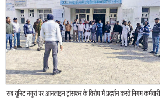
सब यूनिट नगूरों पर आनलाइन ट्रांसफर के विरोध में प्रदर्शन करते निगम कर्मचारी।