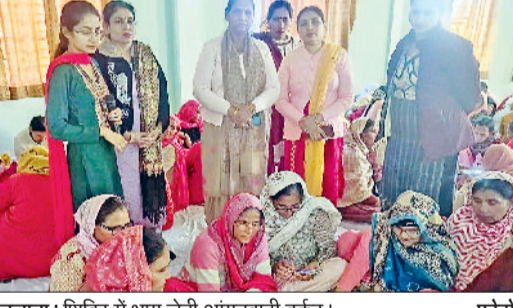
जुलाना। शिविर में भाग लेती आंगनवाड़ी वर्कर।

प्राथमिक शिक्षा का तीन दिवसीय प्रशिक्षण शुरू जुलाना। महिला एवं बाल विकास विभाग द्वारा आंगनवाड़ी कार्यकर्ताओं की कार्यक्षमता बढ़ाने और बच्चों के सर्वांगीण विकास को सुदृढ़ करने के उद्देश्य से पोषण व प्राथमिक शिक्षा विषय पर तीन दिवसीय विशेष प्रशिक्षण कार्यक्रम का आयोजन किया गया। यह प्रशिक्षण जेबीएम कॉलेज में शुरू हुआ। जिसमें क्षेत्र की कुल 96 आंगनवाड़ी कार्यकर्ताओं ने भाग लिया। प्रशिक्षण कार्यक्रम का मुख्य उद्देश्य आंगनवाड़ी केंद्रों पर आने वाले बच्चों को पोषण स्तर में सुधार प्रारंभिक बाल शिक्षा को मजबूत करना तथा कुपोषण की समस्या से प्रभावी ढंग से निपटारा करना। प्रशिक्षण के दौरान कार्यकर्ताओं को यह बताया गया कि किस प्रकार संतुलित आहार, नियमित स्वास्थ्य जांच और खेल-खेल में पढ़ाई के माध्यम से बच्चों के शारीरिक मानसिक और बौद्धिक विकास को बेहतर बनाना जा सकता है। महिला एवं बाल विकास विभाग के अधिकारियों ने कार्यकर्ताओं को बच्चों की उम्र के अनुसार पोषण आहार देने, स्वच्छता पर विशेष ध्यान रखने, गर्भवती महिलाओं की देखभाल तथा सरकारी योजनाओं का लाभ उठा लो। कार्यकर्ताओं को यह बताया कि विषय में विस्तार से जानकारी दी।